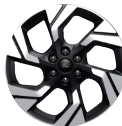
Легкосплавний диск «Active» \varnothing 19 – з елементами кольору Absolute Black (для Active Plus)