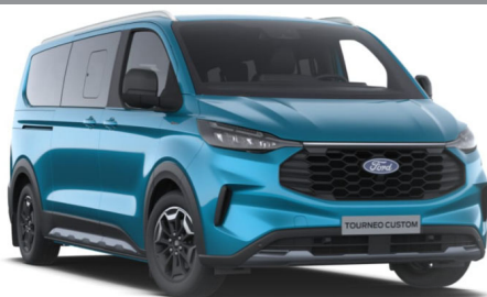
Digital Aqua Blue