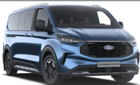
Blue metallic/Chrome Blue