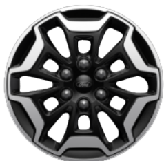
Легкосплавний диск «Active» \varnothing 17 – з елементами кольору Absolute Black (для Active)