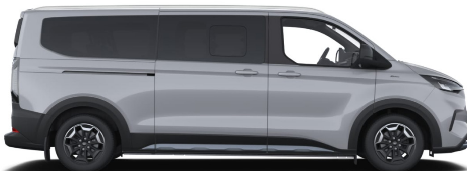
На ілюстрації зображено Tourneo Custom Active L2H1, колір Grey Matter