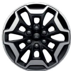
Легкосплавний диск «Active» \varnothing 17 – з елементами кольору Absolute Black (для Active)