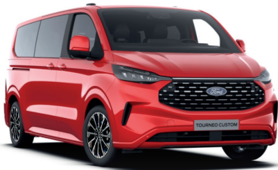
Race Red тільки для Trend