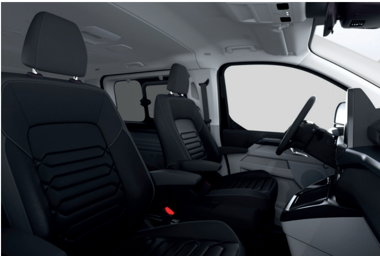
Windsor Style 2, Black Onyx