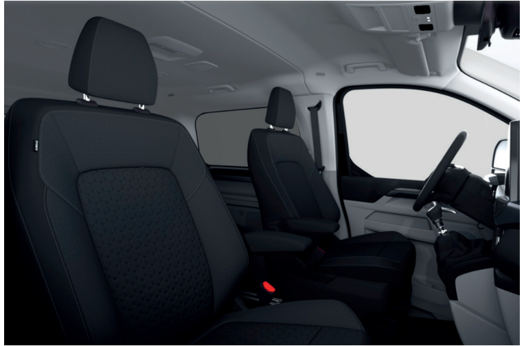
Barlo Style 1, Black Onyx