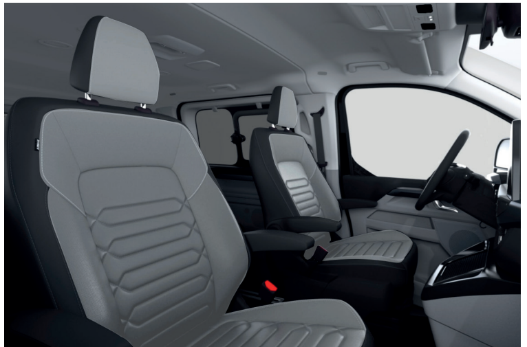
Windsor Style 2, Medium Urban Grey