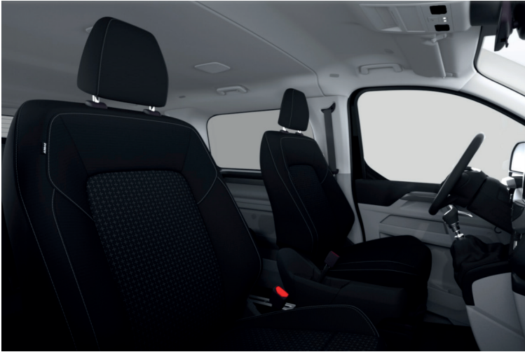
Plus Style 1, Black Onyx