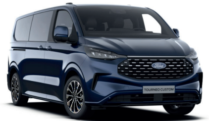
Blazer Blue тільки для Trend