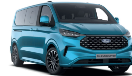
Digital Aqua Blue тільки для Titanium / Titanium X