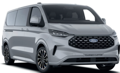
Grey Matter тільки для Titanium / Titanium X