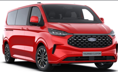
Race Red тільки для Trend