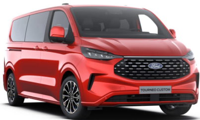
Artisan Red тільки для Titanium / Titanium X