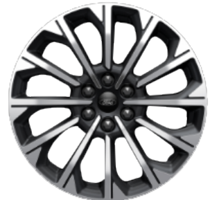
Легкосплавні диски \varnothing 19 - кольору Pearl Grey (для Titanium X)