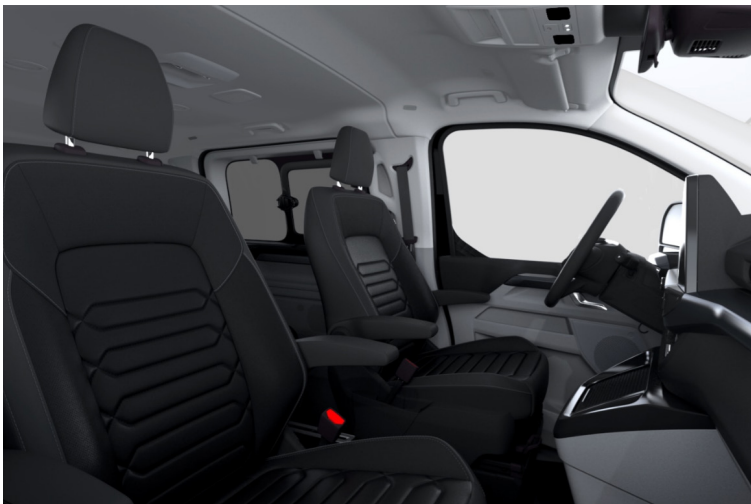
Windsor Style 2, Black Onyx