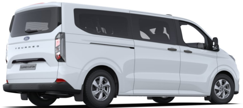
На ілюстрації зображено Tourneo Custom L2H1, колір Frozen White