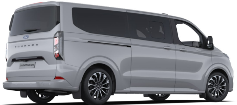
На ілюстрації зображено Tourneo Custom L2H1, колір Grey Matter