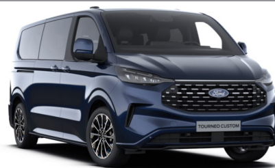
Blazer Blue тільки для Trend