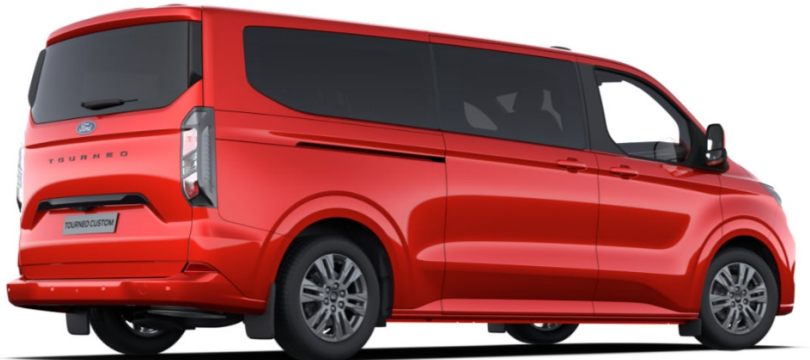
На ілюстрації зображено Tourneo Custom L2H1, колір Artisan Red