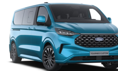
Digital Aqua Blue тільки для Titanium / Titanium X