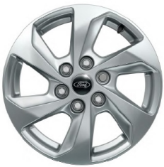
Легкосплавні диски \varnothing 16 - кольору Sparkle Silver (для Trend)