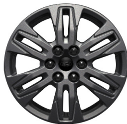
Легкосплавні диски \varnothing 17 - кольору Carbonised Grey (для Titanium)