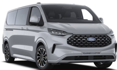
Grey Matter тільки для Titanium / Titanium X