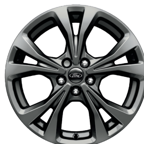
Колісні диски легкосплавні, шини 225/60 R18 (ST-Line Plus, ST-Line X)