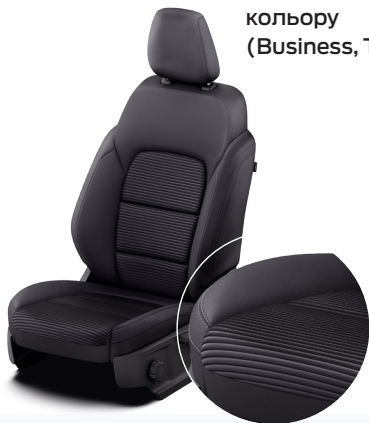
Тканина чорного кольору (Business, Titanium)