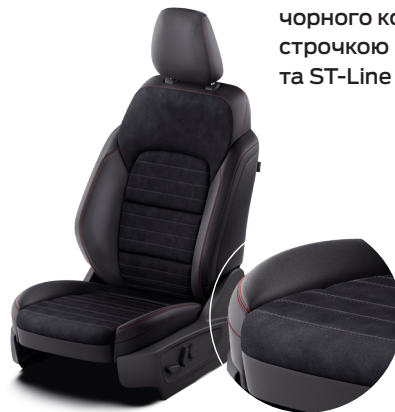
Часткова шкіра (штучна) чорного кольору з червоною строчкою (ST-Line Plus та ST-Line X)