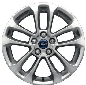
Колісні диски легкосплавні, шини 225/65 R17 (Business, Titanium)