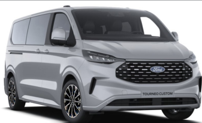
Grey Matter тільки для Titanium / Titanium X