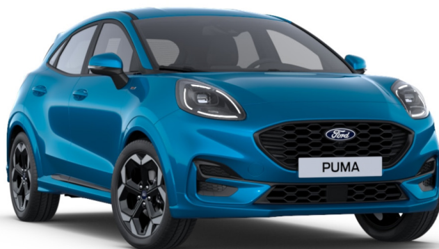
Digital Aqua Blue Metallic*