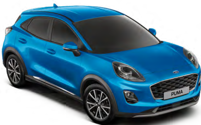
DESERT ISLAND BLUE