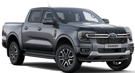
Carbonized Gray/Asher Gray