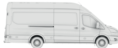
VAN L4H3 (JUMBO 350/470)