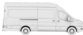
VAN L4H3 (JUMBO 470)

VAN - вантажний фургон N2 (згідно сертифікату) LWB EF (Long Wheel Base Extended Frame - L4 (Jumbo)) - довга колісна база з подовженим кузовом H3 - високий дах RWD - привод на задню вісь