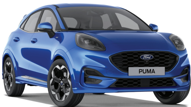
Desert Island Blue*