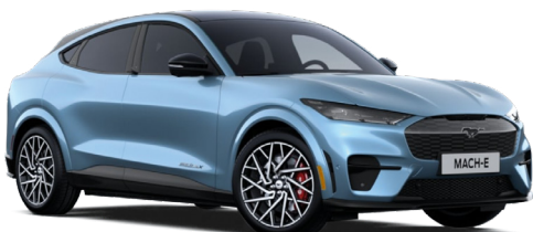
VAPOR BLUE / WHISPER BLUE