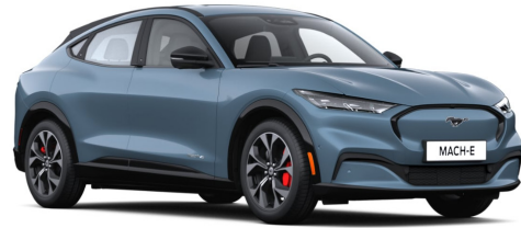
VAPOR BLUE / WHISPER BLUE