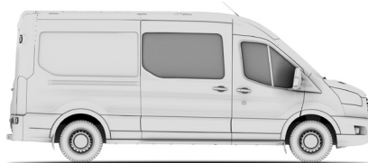
DOUBLE CAB IN VAN L3H2

Kombi – багатощільовий, 9 місць DC IN VAN (Double Cab in Van) – фургон, 6 місць LWB (Long Wheel Base- L3) – довга колісна база H2 – середній дах FWD – привод на передню вісь