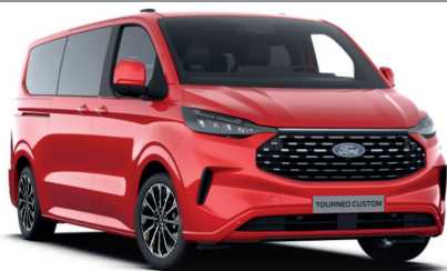
Race Red тільки для Trend