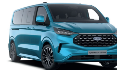
Digital Aqua Blue тільки для Titanium / Titanium X