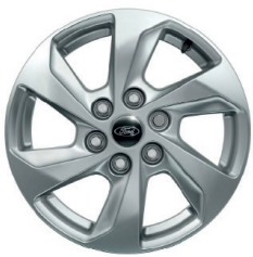
Легкосплавні диски \varnothing 16 - кольору Sparkle Silver (для Trend/Trend Plus)