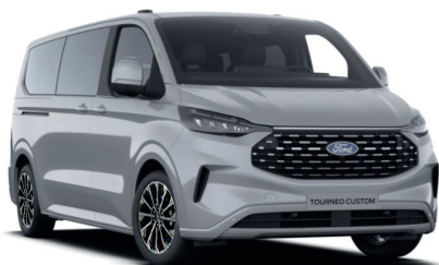
Grey Matter тільки для Titanium / Titanium X