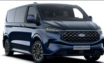
Blazer Blue тільки для Trend