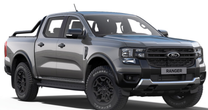
CARBONIZED GRAY/ASHER GRAY