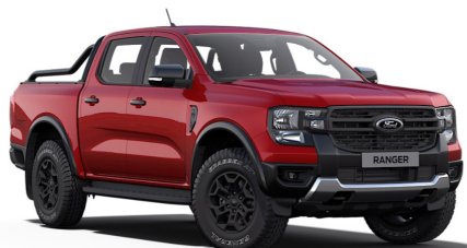
LUCID RED/RED CARPET